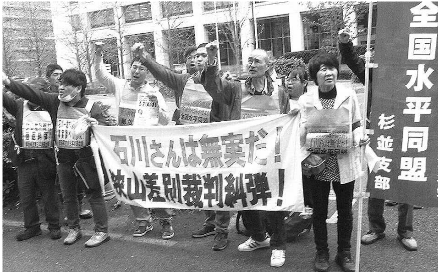
2016・4・21 東京高裁要請行動

9月29日(木) 11時半 日比谷公園霞門集合 12時 デモ出発 14時 裁判所前街宣 15時 東京高裁要請行動