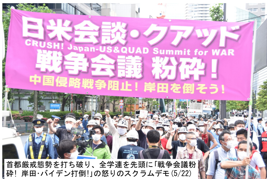
首都厳戒態勢を打ち破り、全学連を先頭に「戦争会議粉碎! 岸田・バイデン打倒!」の怒りのスクラムデモ(5/22)

6月29~30日のNATO首脳会議に、岸田が日本の首相として初めて出席しようとしています。ウクライナ戦争への参戦国としての登場を絶対に許さない!